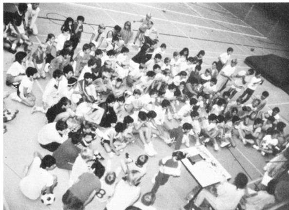
Schnuppertag des TVH