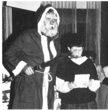
Weihnachten für unsere Kleinen