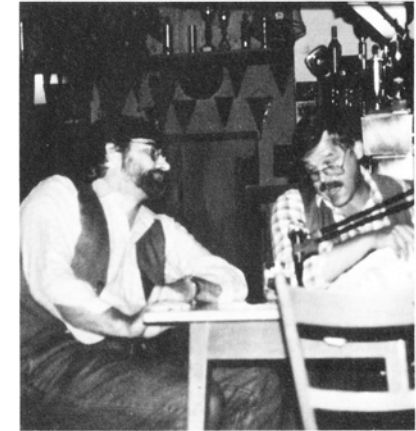
Spätlese beim Weinfest