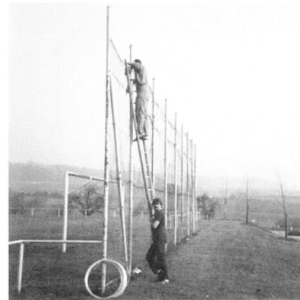
Die „1. Mannschaft“ übt den Aufstieg“