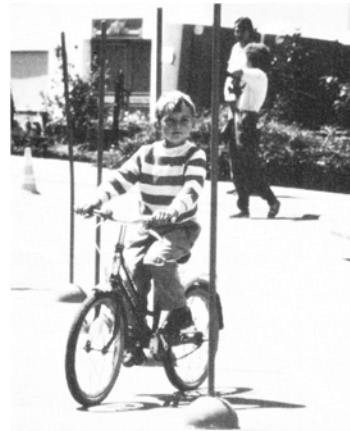
Da wird Geschicklichkeit erfordert