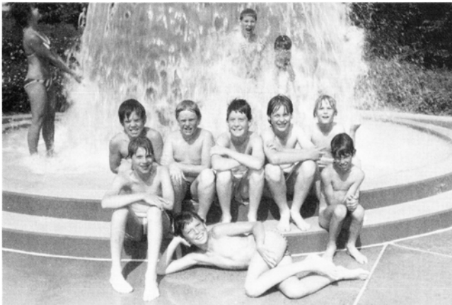
Eine kleine Abkühlung beim Handballturnier in Steinheim