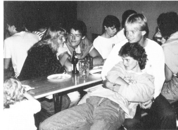
Unsere 1. Mannschaft im Trainingslager