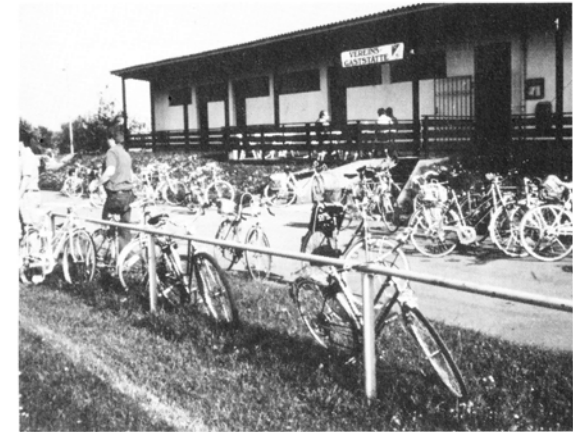
Radtour nach Rottenburg Abschluß auf dem Sportplatz