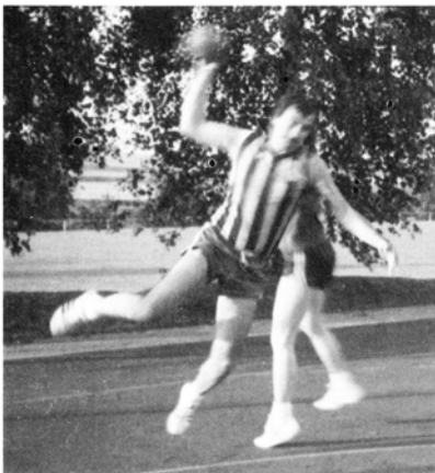
„Vize Pflugi“ zeigt, was er noch drauf hat