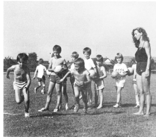
Die zukünftigen Meister üben noch