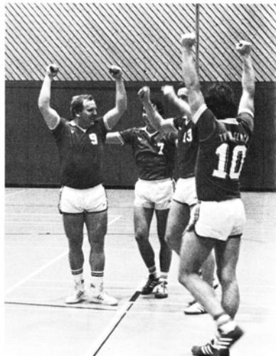
So wollen wir die Saison beenden