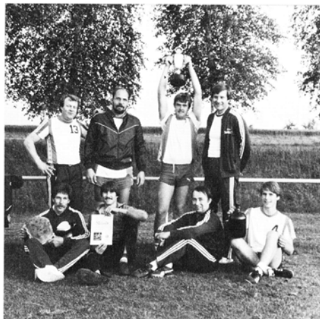
Ortsmeister 1983 – Die Spätlese verstärkt mit Nachwuchs