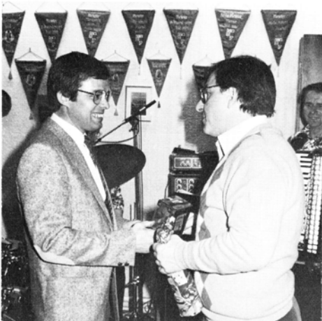
Die Ehrung folgt auf die Meisterschaft