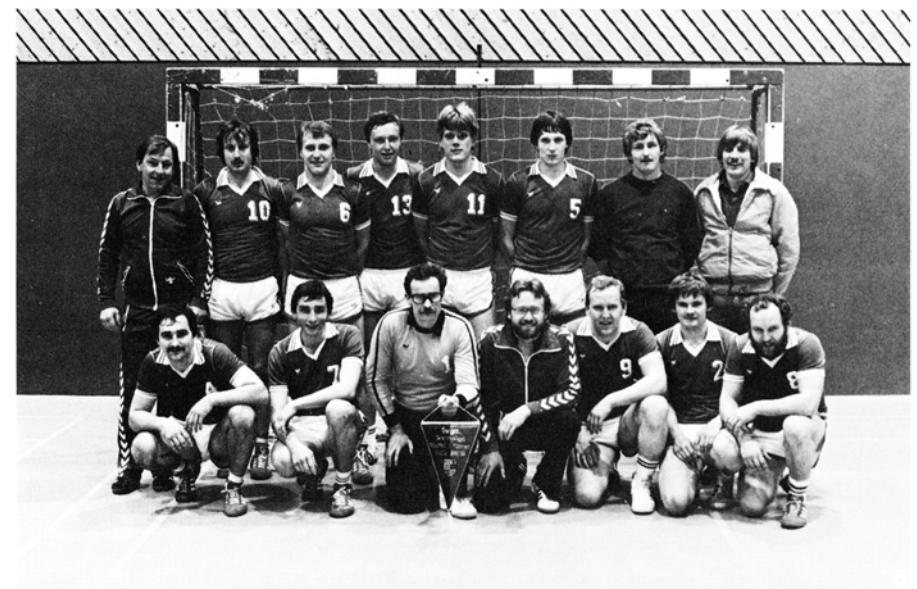
Die Meistermannschaft der Bezirksklasse Staffel I 1982/83