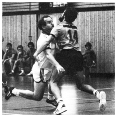
Ein neuer Tanz bei der Premiere